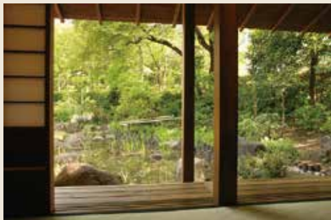
輪亭からふるさと池を望む